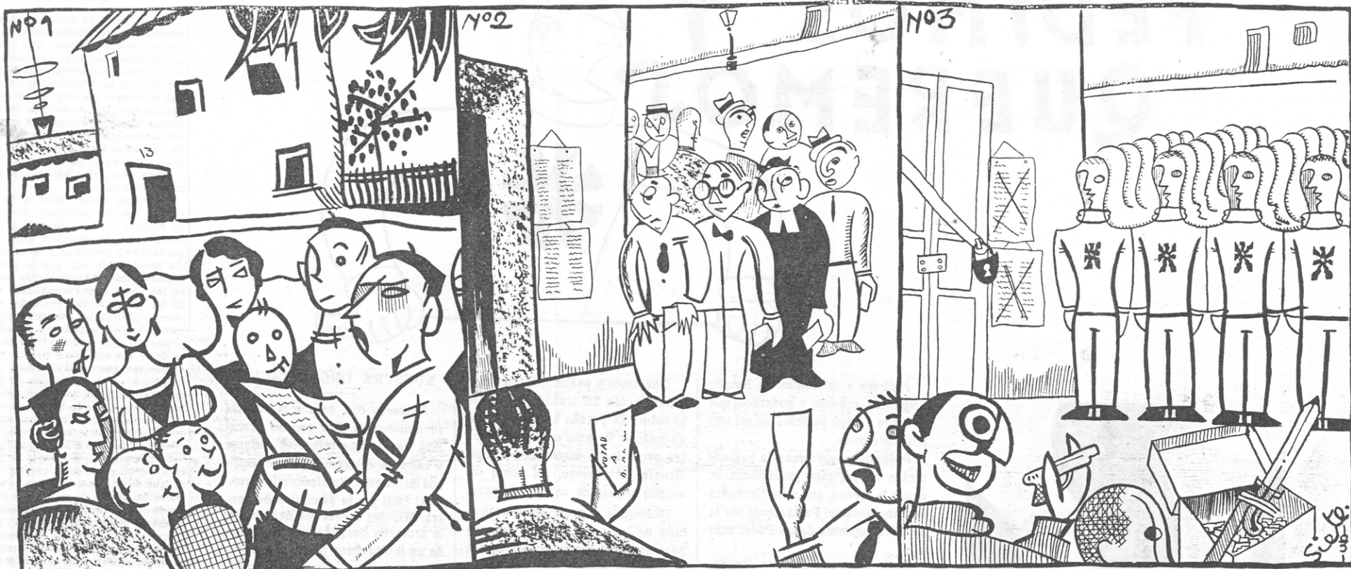
Se lee un bando al pueblo: Elecciones. Cortes Constituyentes. —¡Ciudadanos! ¿Queréis que se burlen de vosotros? ¡¡Pues votad!!