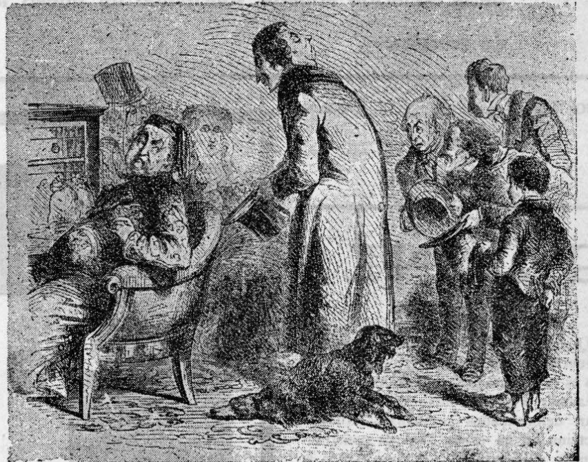
Organización de una propaganda social