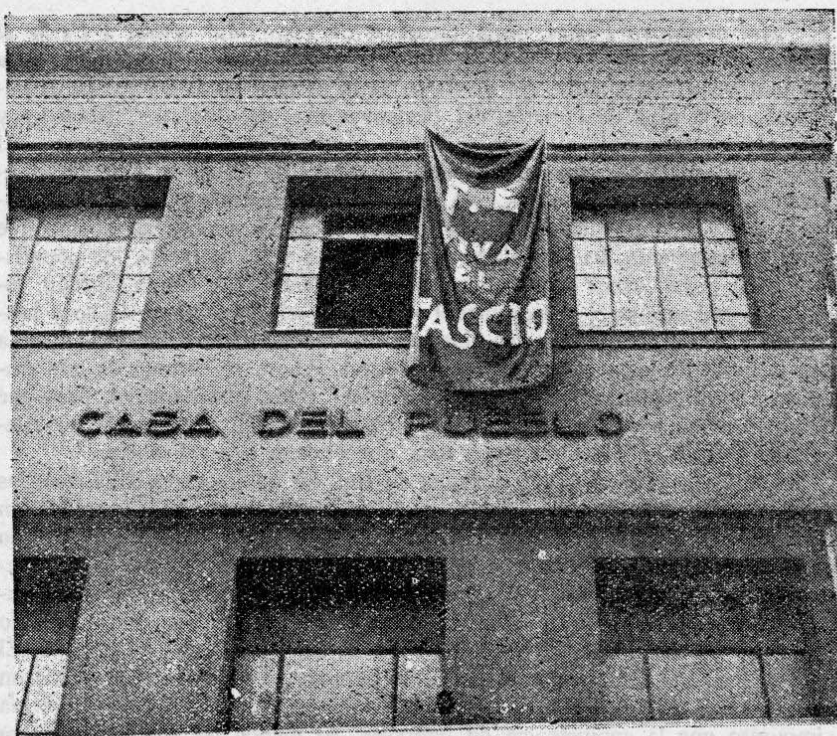
La "Casa del Pueblo", de Madrid, apareció la otra mañana engalanada con una bandera en la que se leía "F. E. ¡Viva el Fascio!" El autor de la empresa, parece, aunque no milita en nuestras filas, lleno de nuestro espíritu. ¡Qué diferencia de tácticas! El riesgo limpio, entusiasta, jugando la contrapartida a la asesina zafiedad de los que quieren aniquilar a España.

En la imprenta donde se tira nuestro semanario ha estallado una bomba de gran potencia. Algunos de los operarios han resultado heridos, aunque levemente por fortuna. ¡He aquí los métodos de que se valen los que se dicen defensores del proletariado!