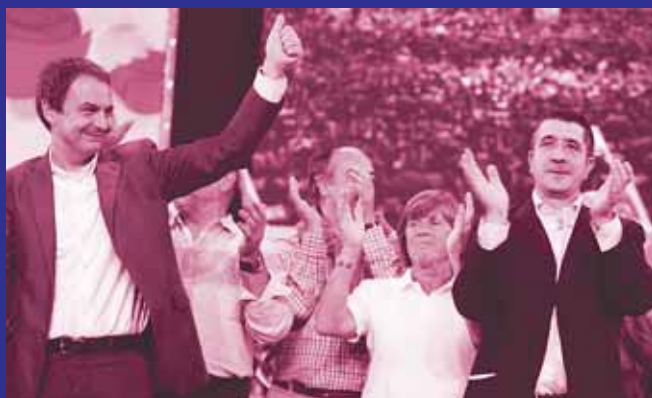
Mentira institucionalizada: líderes burgueses al mando de un partido "obrero"

La desigualdad salarial entre ejecutivos y trabajadores se ha multiplicado por más de diez en los últimos 20 años. El sueldo de los directivos creció en 2006 un 30,9% y los beneficios de las empresas lo hicieron en un 26,6%, pero las nóminas de los asalariados sólo aumentaron un 3,4%.