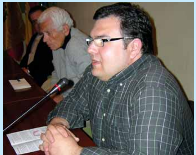
Norberto Pico, el futuro de la Falange