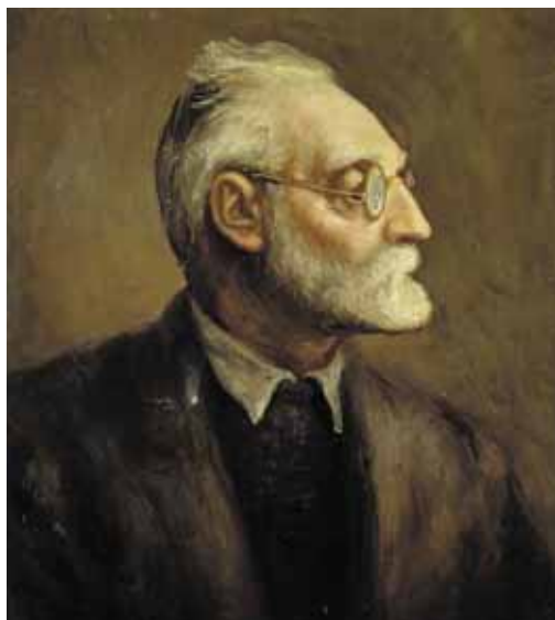
Miguel de Unamuno y Jugo