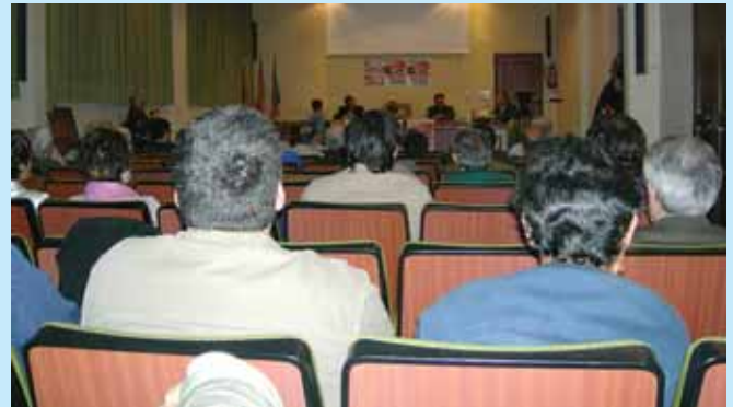
Instantánea desde el fondo del Salón de Actos